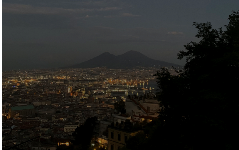
Belvedere San Martino, Napoli